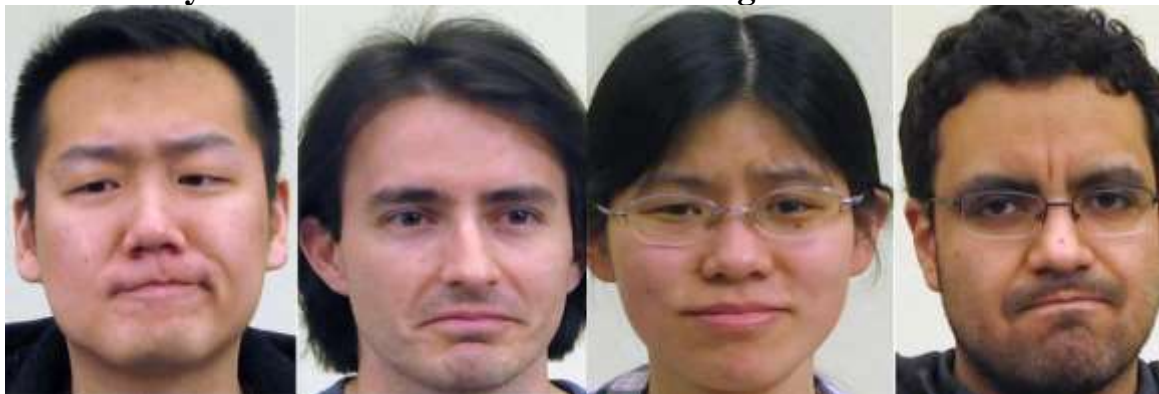
‘Not’ faces.