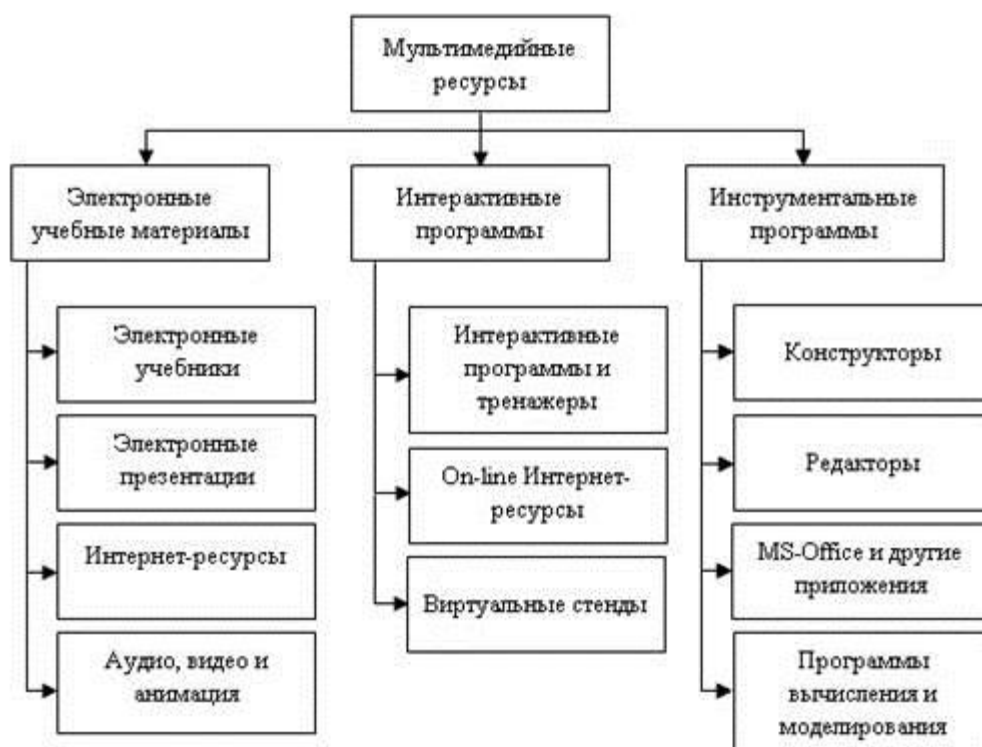
Рисунок 2 – Классификация мультимедийных ресурсов