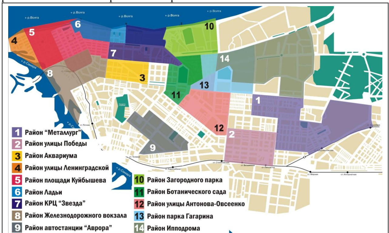
Рисунок 2. Психологические районы, выделенные группой «студентов» (СГПУ, СамГУ, СГО СГППК и ВШПП).

ет «Исторический центр города». Достаточно высокое значение приобретают район «Безымянки» и район «Набережной».