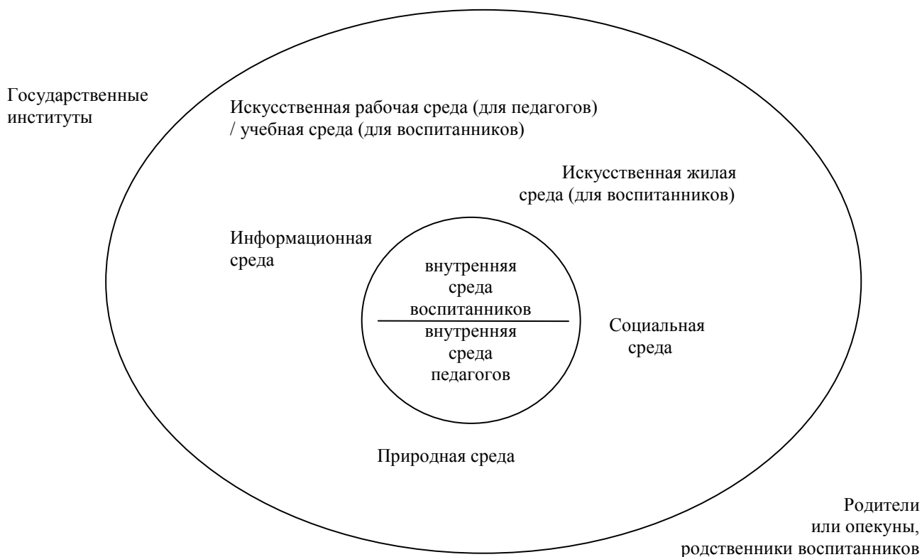
Рис. 1. Структурная схема образовательного пространства интернатного учреждения

Внешнее поле представляют государственные институты, с одной стороны, и опекуны, родственники воспитанников, с другой. Не являясь прямыми участниками образовательного пространства интерната, они оказывают большое влияние как на его отдельные компоненты, так и на все пространство в целом (рис.1).