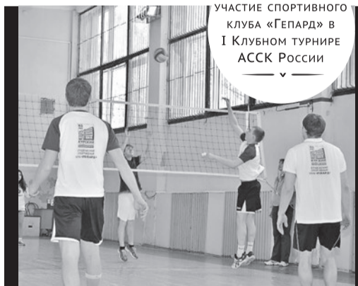
УЧАСТИЕ СПОРТИВНОГО КЛУБА «ГЕПАРД» В I КЛУБНОМ ТУРНИРЕ АССК РОССИИ

Несмотря на то, что объединение существует не так давно, студенты уже успели проявить себя. Одно из последних ярких событий в жизни «Гепарда» — участие в I клубном турнире АССК России, посвященном Дню защитника Отечества. Комплексное спортивное мероприятие включало в себя соревнования по следующим видам спорта: плавание, настольный теннис и волейбол, в котором «Гепарды» и заняли почетное место победителя. «Состязать-